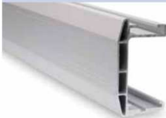
A Rail Main rail Rail