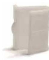
Inserto nylon Nylon insert Patin de guidage