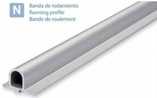
Banda de rodamiento Running profile Bande de roulement