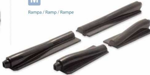
Rampa / Ramp / Rampe