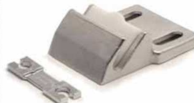
Guía lado apertura Guide / Opening side Guide ouverture