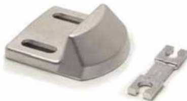
Guía lado cierre Guide / Closing side Guide fermeture