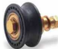
Eje Rulina 2320 Roller and bolt 2320 Galet et visserie 2320