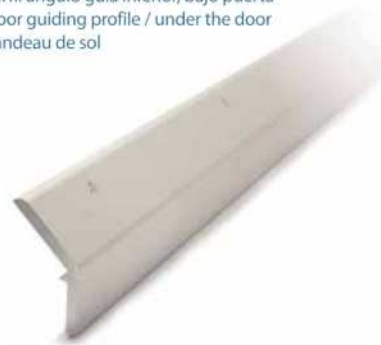
Perfil ángulo guía inferior, bajo puerta Floor guiding profile / under the door Bandeau de sol